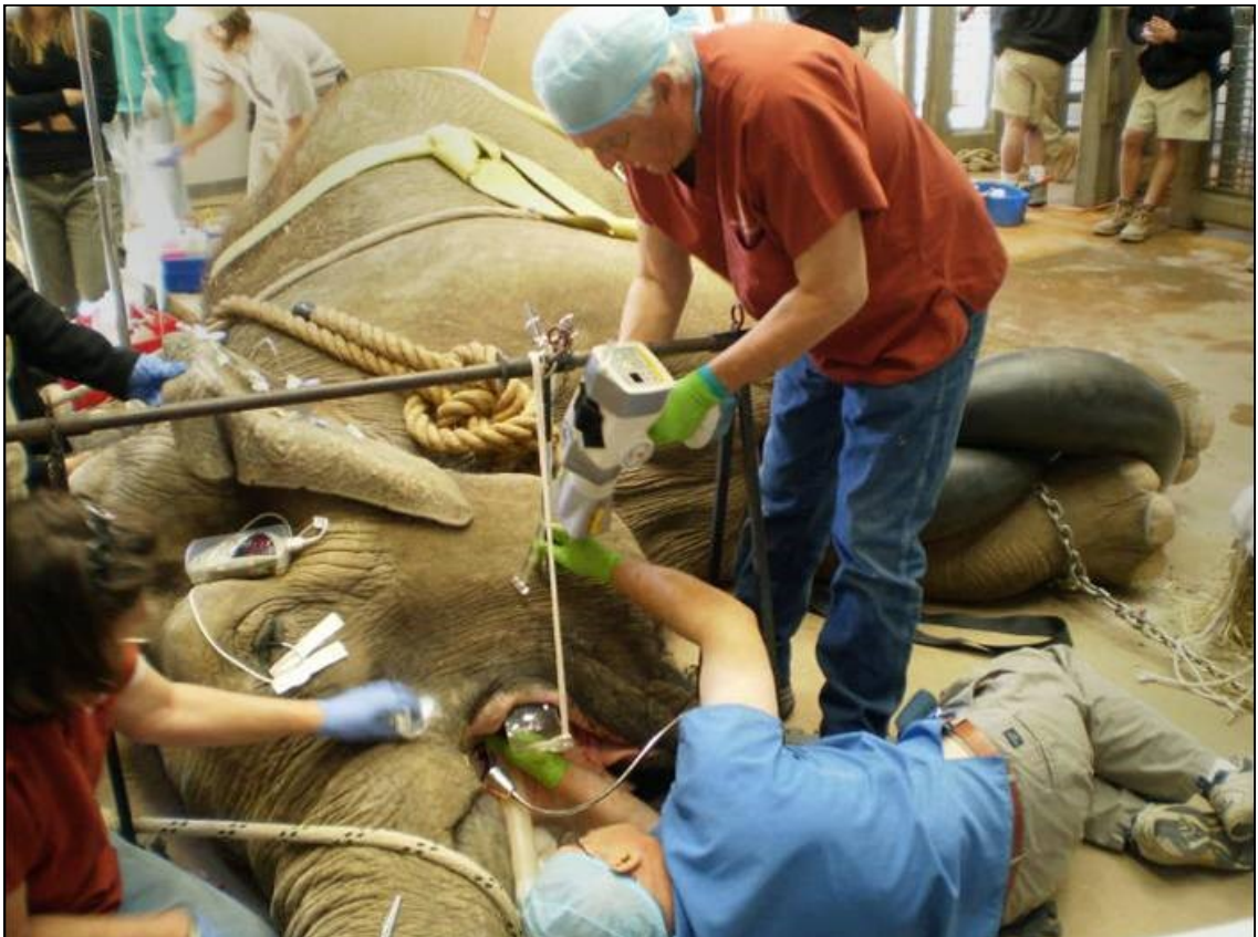
Det finns smådjursveterinärer och stordjursveterinärer. Bilden visar en stordjursveterinär.