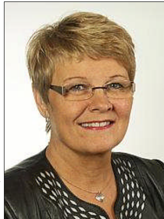
Näringsminister Maud Olofsson

läsa: "nästa delegation stod dock och stampade i farstun" . Några ytterligare upplysning-