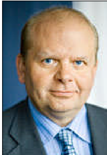
Jordbruksminister Eskil Erlandsson

En annan modell bygger på nuvarande marknadsordning , men med ett snävare uppdrag till distriktsveterinärerna. Det snävare uppdraget innebär att den statliga distriktsveterinärorganisationen behålls, men med ett begränsat uppdrag att svara för lantbruksdjur och jour för dessa samt för smittskyddsorganisatio-